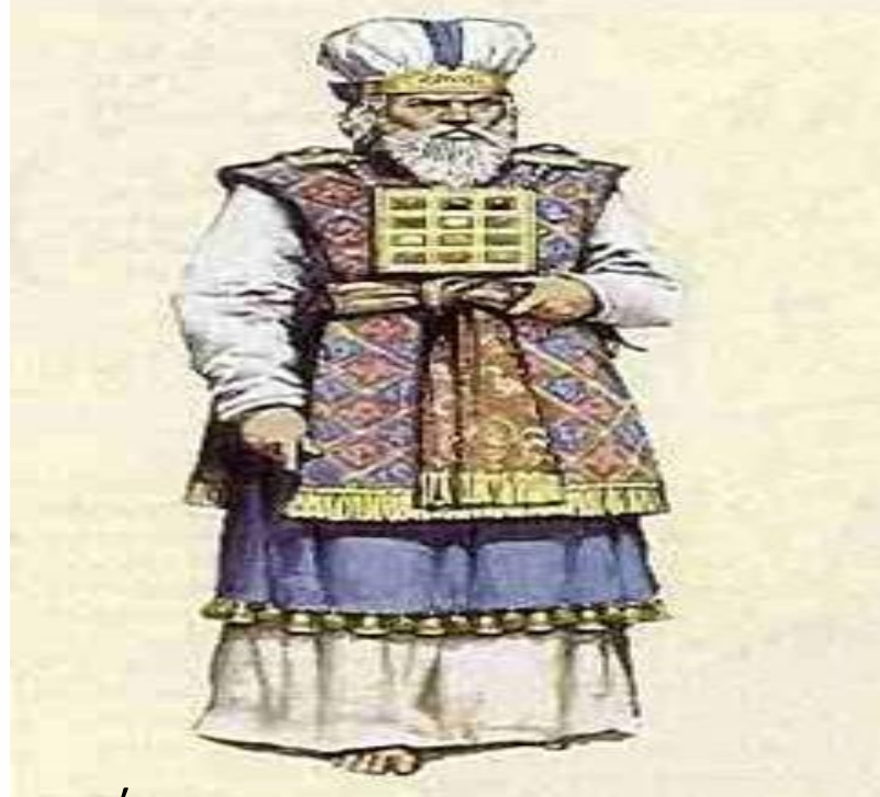
Εικόνα 1: Αρχιερέας.